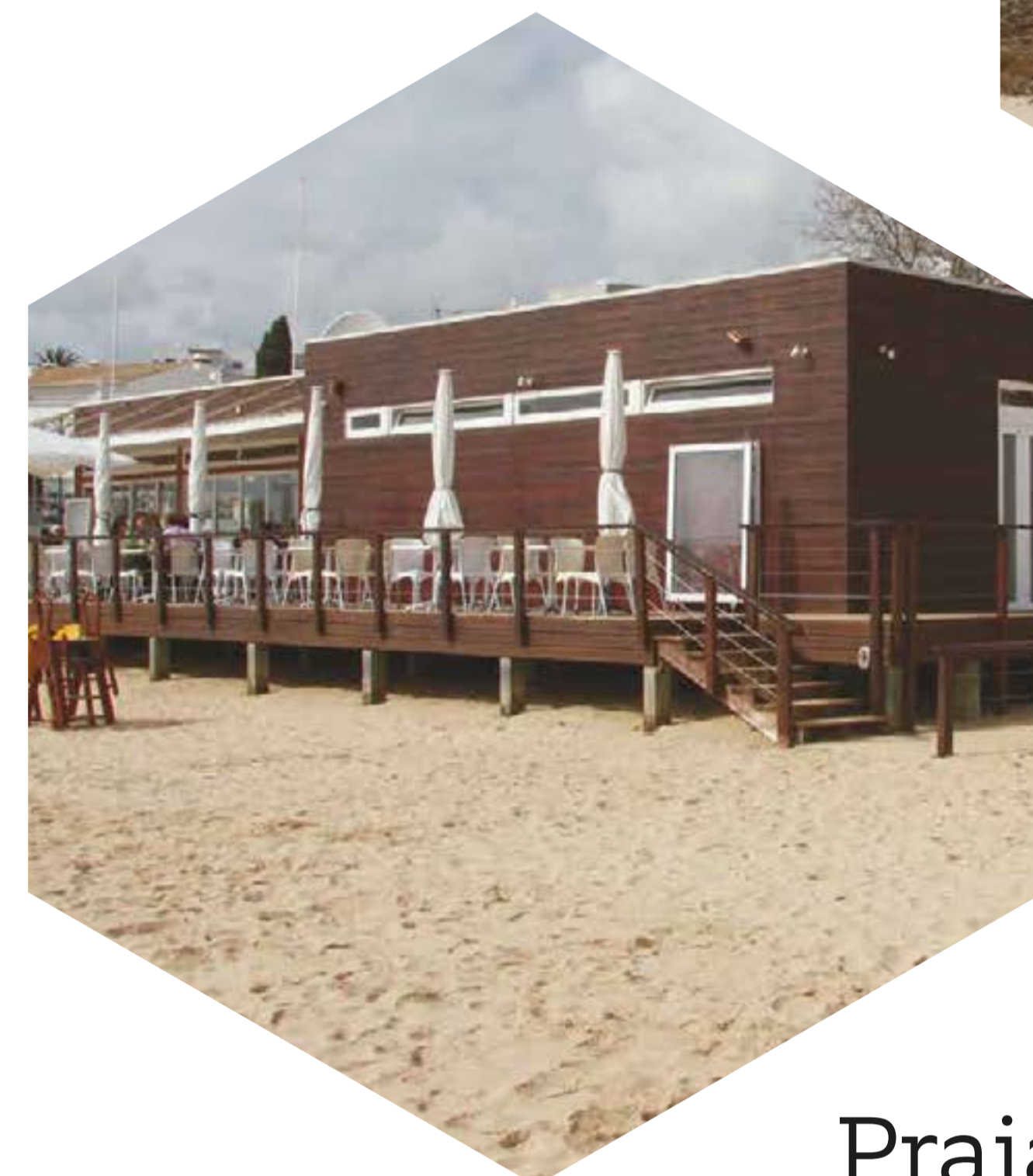
Praia da Luz