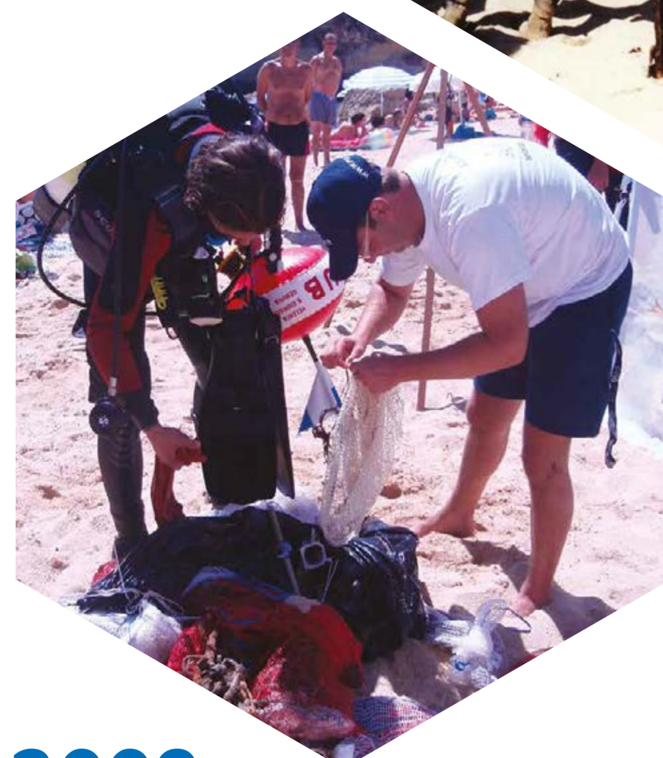
Ações de limpeza subaquática. Praia da Luz e Praia da Batata