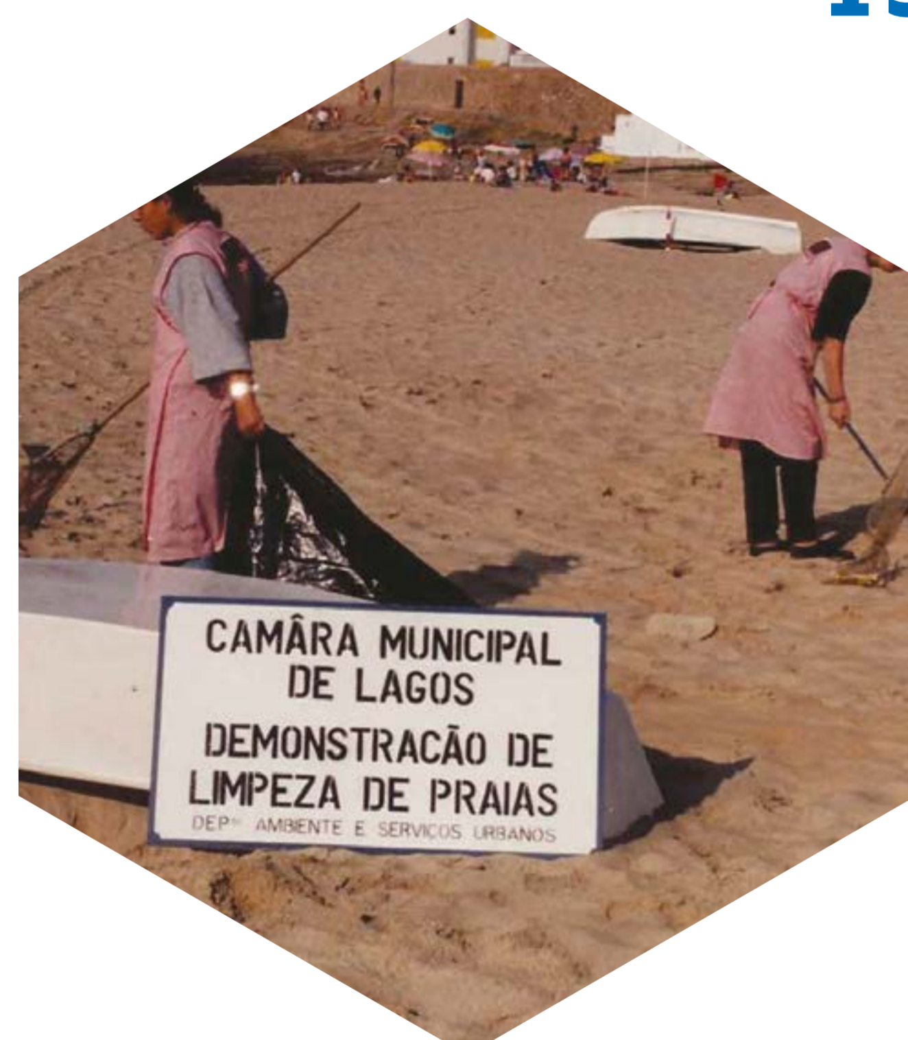
Ação Demonstração de Limpeza de Praias Praia da Luz e Porto de Mós