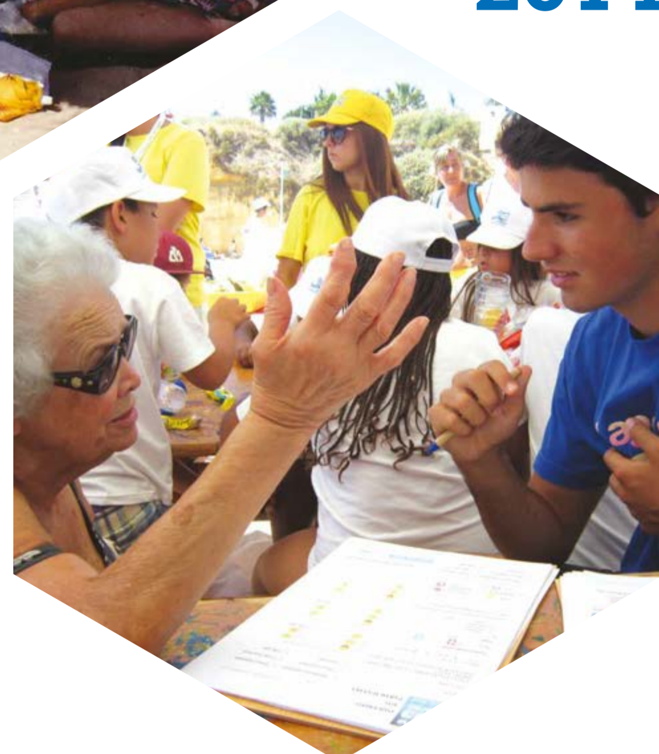
Realização de inquéritos aos banhistas (sobre o ambiente)