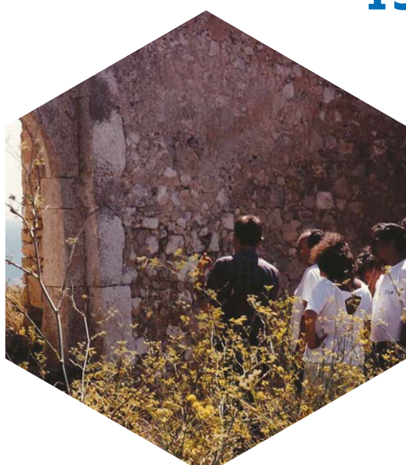
Visitas às fortificações marítimas – Meia Praia