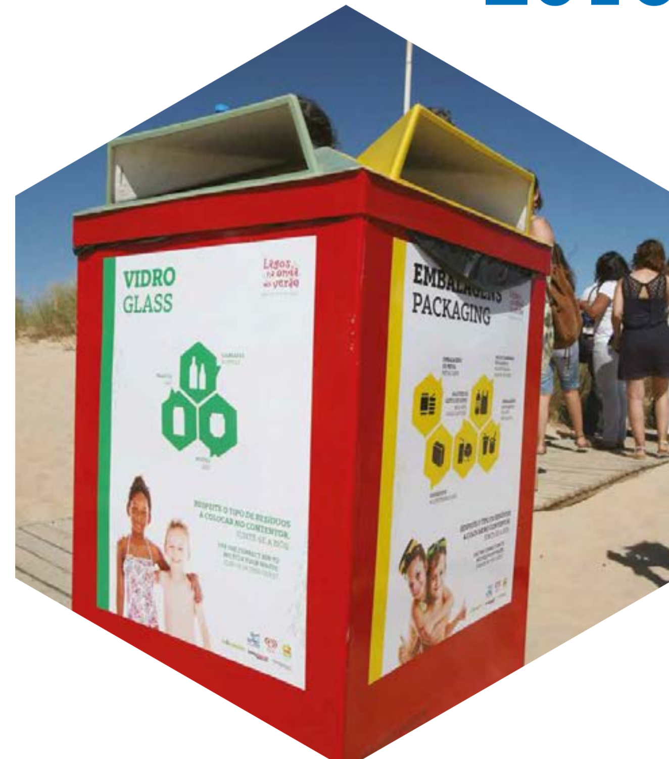
Recipientes próprios para a deposição dos resíduos