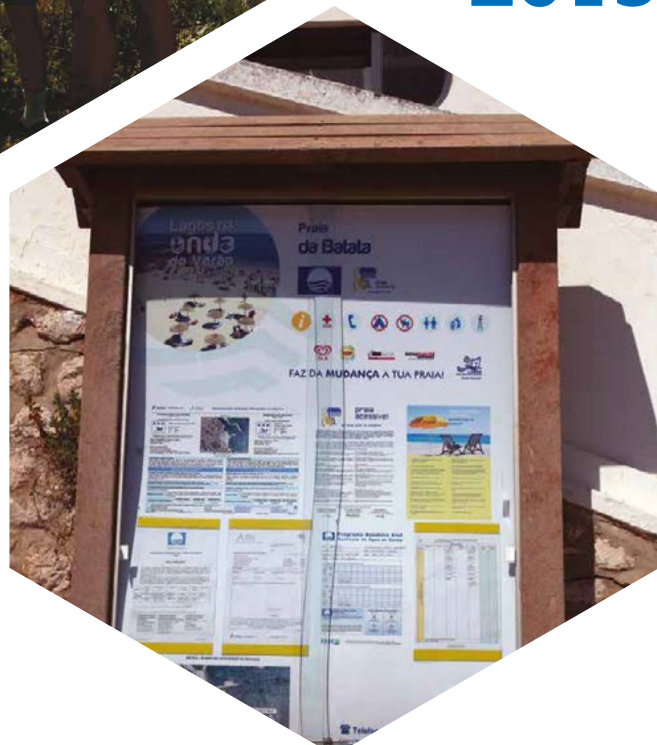
Painéis informativos nos acessos às praias