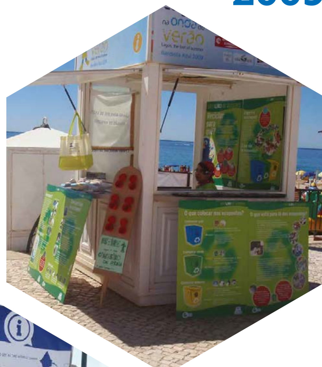
Quiosques informativos da Bandeira Azul