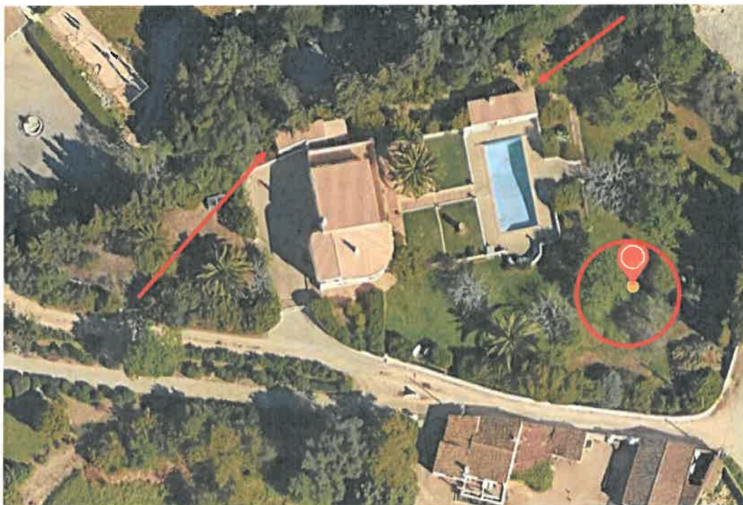
Ortofotomapa com indicação das áreas identificadas com discrepâncias