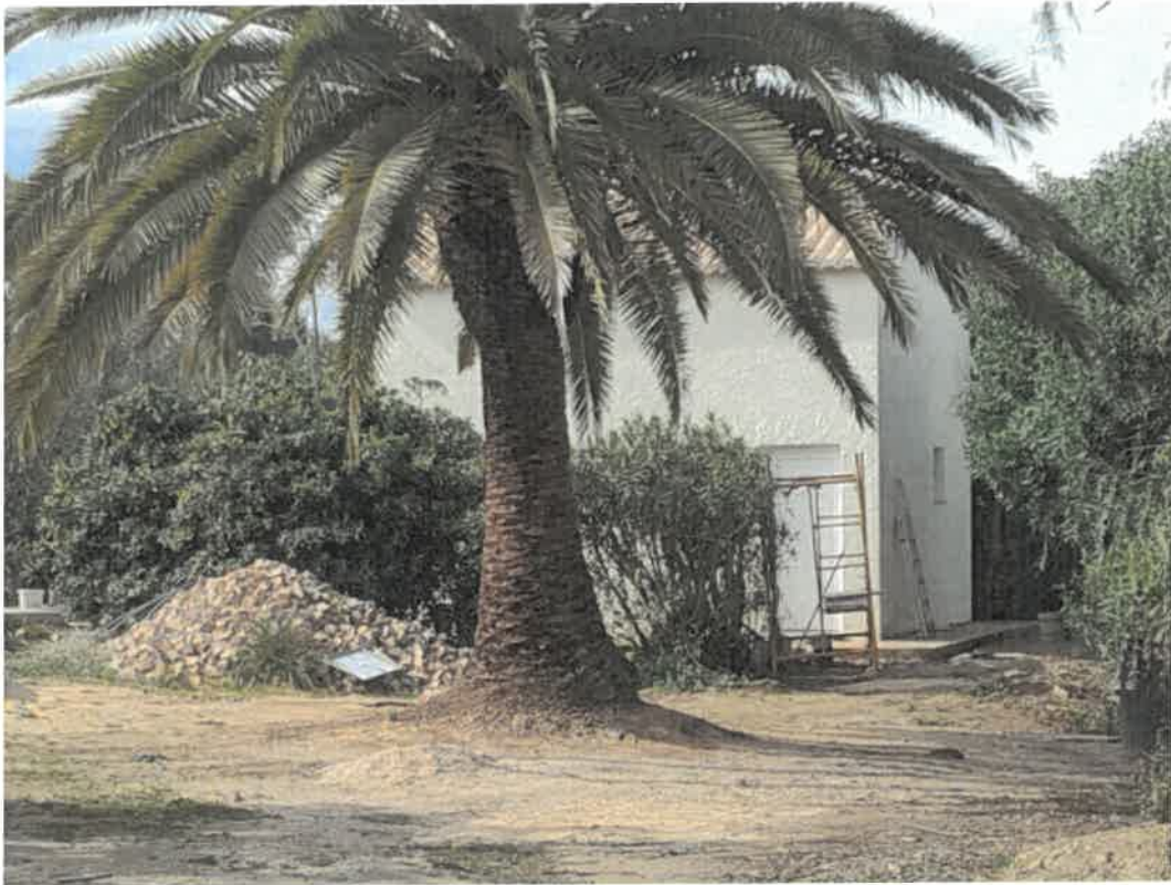
Imagem do existente no local - inf. nº7968/2022-JS de 14/03/2022

No local identificado no ortofotomapa com um circulo verificou a fiscalização que foi edificado um anexo, tal como demonstra a imagem seguinte, com aprox. 30m 2 .